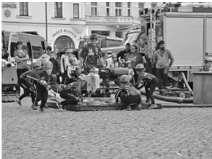
Společná fotografie mladých hasičů, vedoucích a starosty SDH