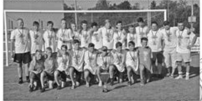
STARŠÍ ŽÁCI - VÍTĚZ KRAJSKÉHO PŘEBORU 2017/2018