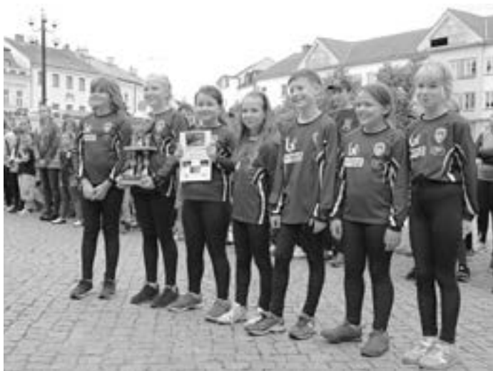
Mladší B při Požárním útoku

Mladí hasiči v sobotu 23. 6. 2018 úspěšně ukončili další sezónu. Ukončení sezóny je již tradičně spjato s poslední soutěží Velké ceny mladých hasičů OSH Uherském Hradišti, kam se sjela družstva z celého okresu, aby mohla naposledy před prázdninami změřit své síly. Rekordní účast 28 soutěžních družstev naznačovala vysokou úroveň soutěže v kombinaci s náročným povrchem Masarykova náměstí v Uherském Hradišti. Již tradičně soutěž zahájila disciplína Štafet požárních dvojic, kde se družstvo mladších A umístilo na 2. místě hned za družstvem z Míkovic. Družstvo mladších B se pak s výsledným časem 101,22 sekund umístilo na 11. místě. V kategorii starších se naše družstvo umístilo na 5. místě (čas 56,38 sekund), které by však znamenalo sestup z průběžného 3. místa Velké ceny MH OSH UH. Do výsledků Požárního útoku pak výrazně promluvil kluzký povrch dlažebních kostek náměstí, který komplikoval sestříky řady soutěžních družstev. I přes tuto náročnost družstvo mladších A tuto disciplínu vyhrálo s časem 18,30 sekund s více jak dvousekundovým náskokem na druhé družstvo z Míkovic. Družstvo mladší B rovněž nezůstalo pozadu a s časem 22,72 sekund obsadilo 5. místo. Celkově pak mladší B skončili na 8. místě a družstvo mladších A skončilo na 1. místě a odvezlo si Putovní pohár