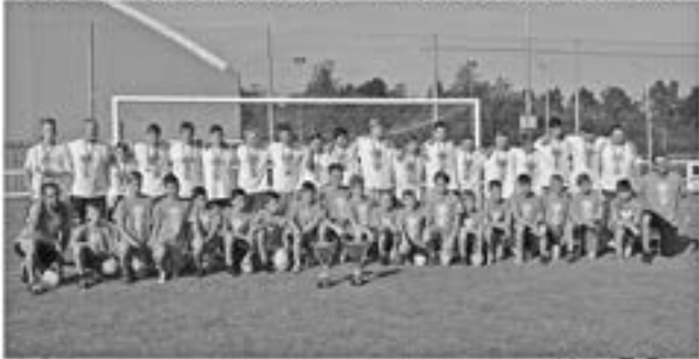
DVA NOVÁČCI PŘEBORU = DVA POHÁRY 2017/2018