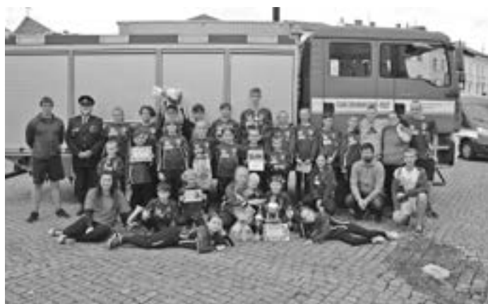
Družstvo mladších A při vyhlášení výsledků