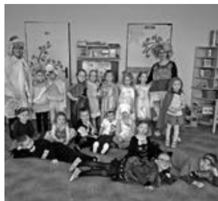
KMŠ Staré Město