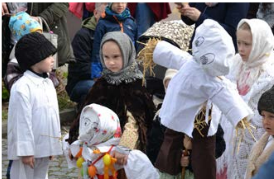
Mařena s mařákem