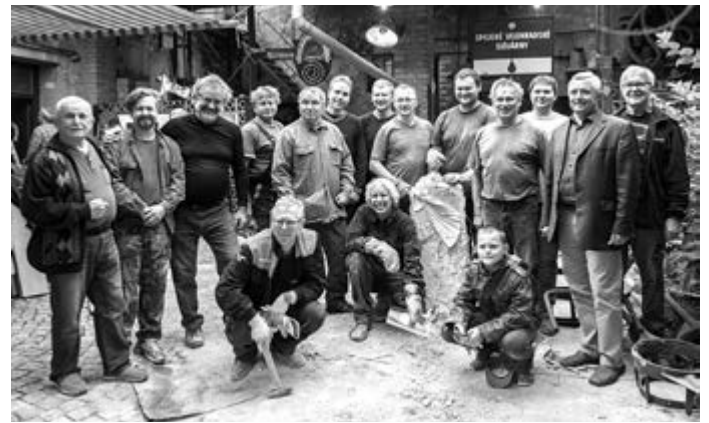
Všechny fotografie: František Ingr. Člověk a víra