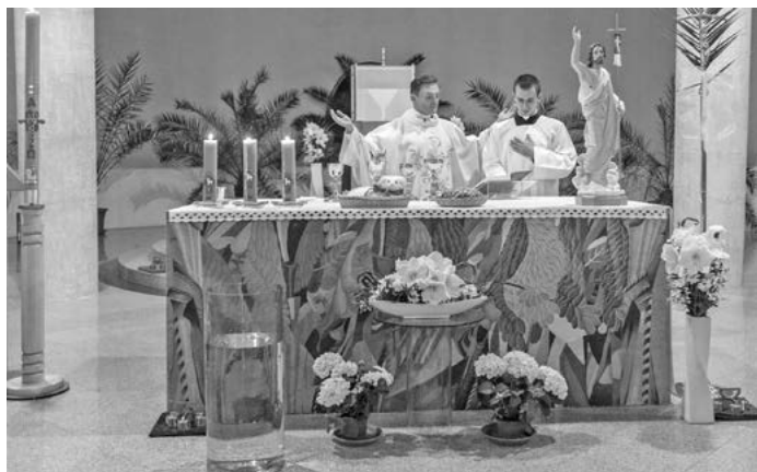
Člověk a víra