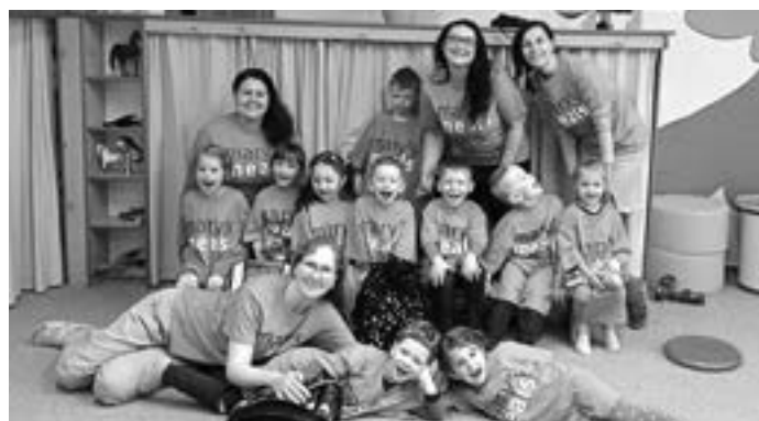
Batůžkový projekt 2.třída