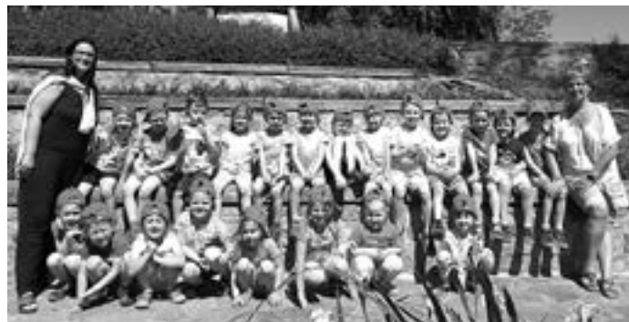
Výlet Halda 2.třída