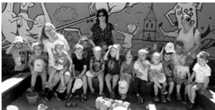
Výlet Halda 1.třída