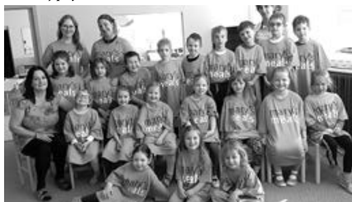
Batůžkový projekt 3.třída