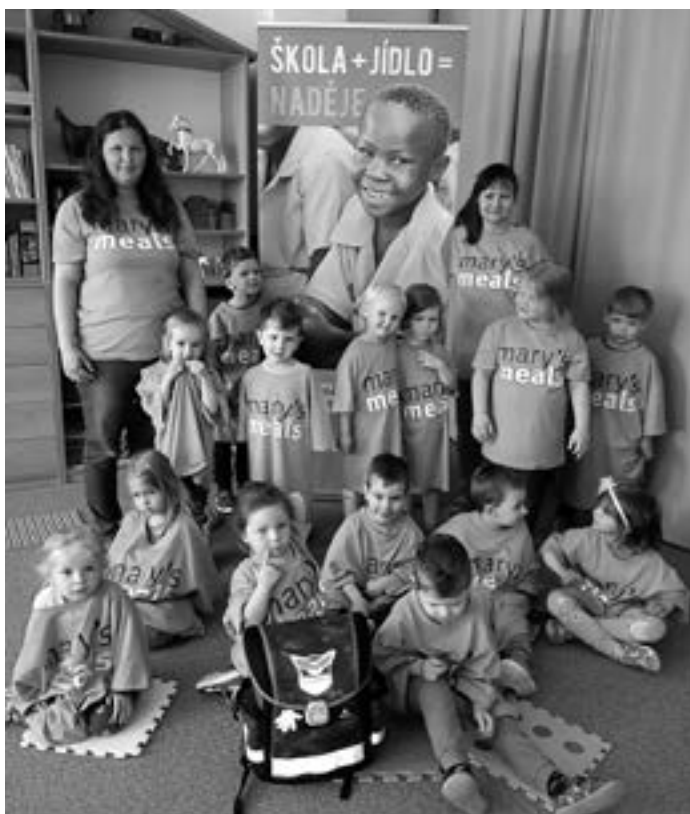
Batůžkový projekt 1.třída