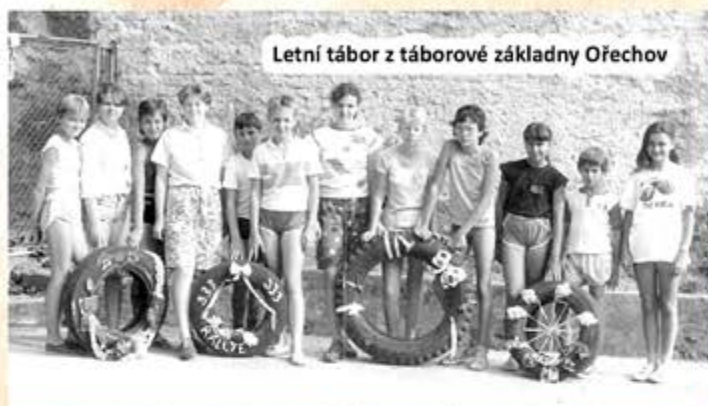
Letní tábor z táborové základny Ořechov