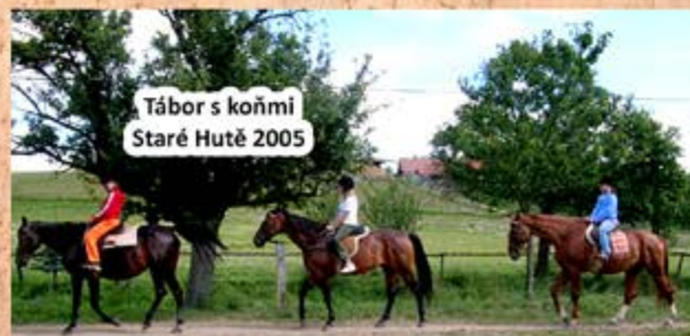
Tábor s koňmi Staré Hutě 2005