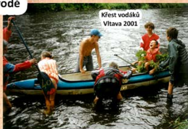
Křest vodáků Vltava 2001