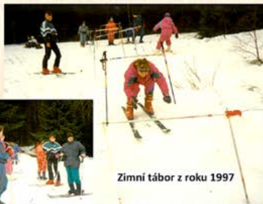
Zimní tábor z roku 1997