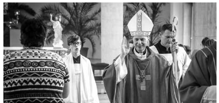
Člověk a víra